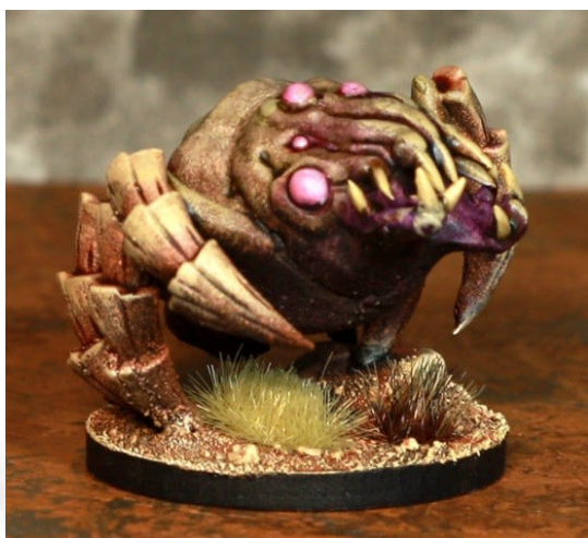
Peintures Minus, Sculpture Cédric Snowmodel

Les sources ont tendance à apparaître là où la vie foisonne. Vous pouvez charger plus que d'habitude votre table de jeu : Zone d'eau, plantes multiples... N'hésitez pas non plus à mettre des créatures non-joueurs dans le scénario à 2 joueurs.